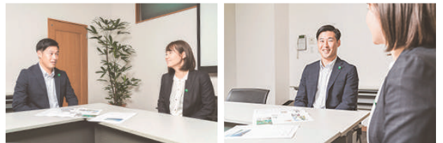
福井三菱電機機器販売株式会社

1984年に福井地域における三菱電機の流通機構整備強化のため創立し、北陸三菱電機商品販売株式会社福井支店より汎用電機機器の営業部門および北菱電興株式会社福井営業所より冷熱空調機器部門を継承するとともに昇降機、画像通信応用機器並びにFAメカトロニクスなどを取扱う三菱電機の総合代理店。