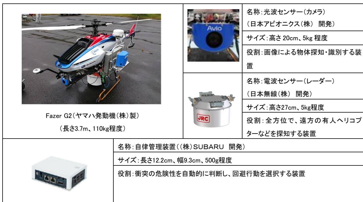
図1 中型の無人航空機と衝突回避システム構成機器