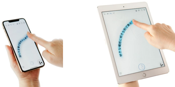
「しゃべり描き®アプリ」の使用イメージ(左:スマートフォン、右:タブレット)

兼松コミュニケーションズ株式会社(以下、兼松コミュニケーションズ)と三菱電機株式会社(以下、三菱電機)は、聴覚障がい者支援団体などを対象に、話した言葉を指でなぞった軌跡に表示する「しゃべり描き®アプリ Biz」の無償提供を 9 月 4 日に開始しますのでお知らせします。新型コロナウイルス感染症対策としてマスクを着用することが常態化し、口元が見えずコミュニケーションに困るシーンにおいて本アプリをご利用いただくことで、円滑なコミュニケーションの実現に貢献します。