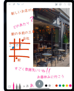
新たに追加した「コミュニケーション UI」

左: ツールを常時表示した基本画面(ワンタッチで操作が可能) 右: コミュニケーション UI を用いた会話例