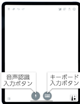
横並び表示した 入力ボタン

左: ツールを常時表示した基本画面(ワンタッチで操作が可能) 右: コミュニケーション UI を用いた会話例