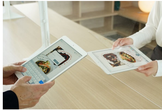
「音声入力」と「キーボード入力」でのコミュニケーション例