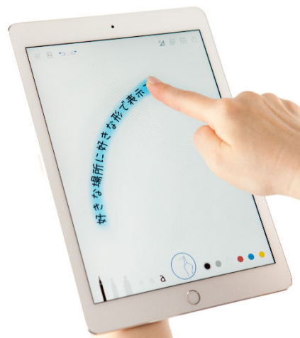
「しゃべり描き®アプリ」の使用イメージ