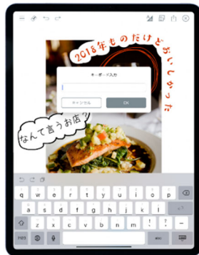
キーボードでの入力例