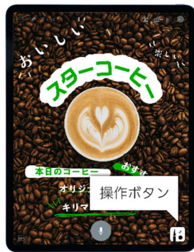
従来の「クリエイティブ UI」

左: 操作ボタンを押すことで現れる豊富なツールパレット 右: クリエイティブ UI の基本画面と作成した画像編集例