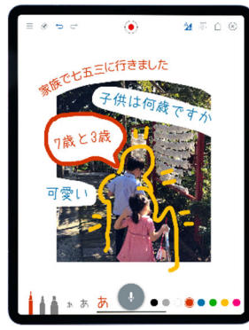
「近距離通信機能」を使ったソーシャルディスタンスを保ったコミュニケーション