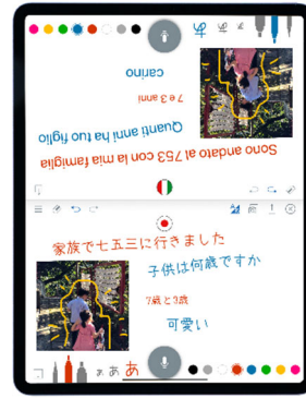
従来の「対面表示機能」を使った密なコミュニケーション