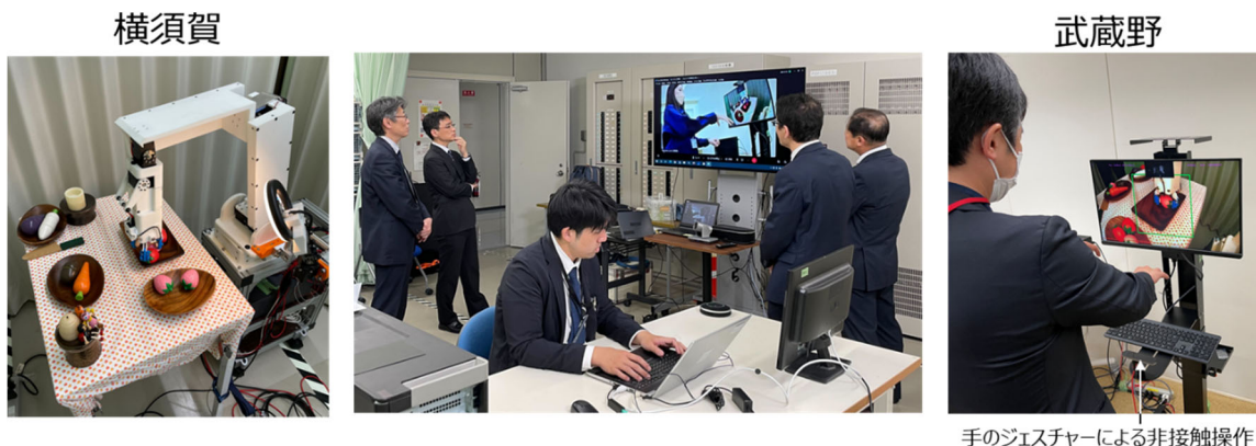
図 3 実証実験の様相