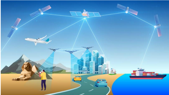
地上各地とつながる宇宙光通信のネットワークイメージ